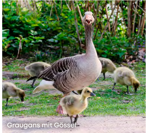
Graugans mit Gössel

Bei Gänsen ist das „Flirten“ Männersache. Das heißt, dass der Ganter (die männliche Gans), der einen Kampf gewonnen hat, also einen Rivalen vertrieben hat, sich dann laut rufend – und damit seinen Sieg verkündend – auf die Auserwählte zu bewegt. Diese geht entweder auf die „Anmache“ ein oder trollt sich.