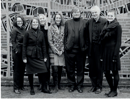
Das A Capella Ensemble

22. APRIL 2018 | 17:00 | KIRCHE ST. PETER