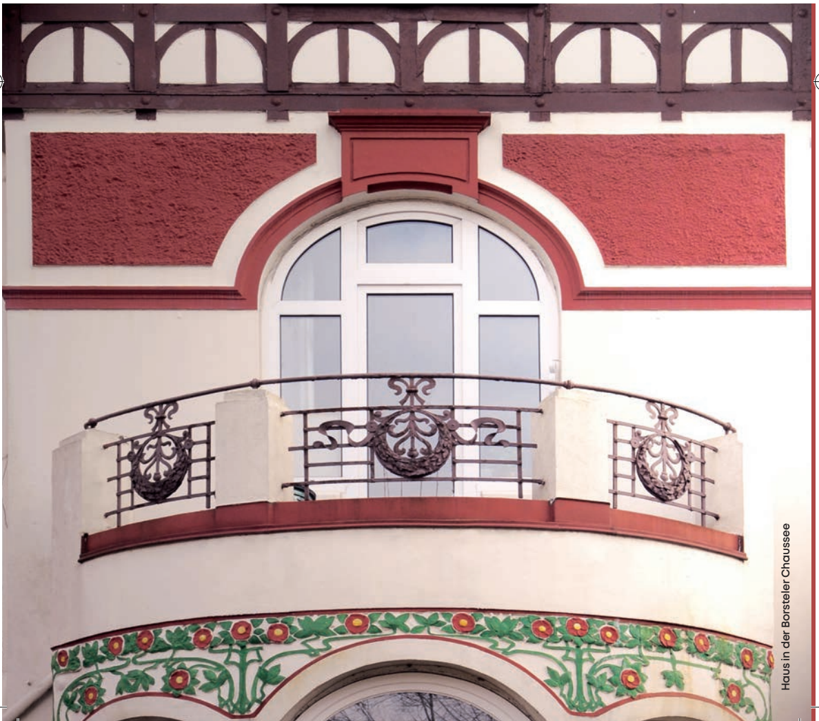
Haus in der Borsteler Chaussee

KOMMUNAL-VEREIN VON 1889 IN GROSS-BORSTEL R.V.