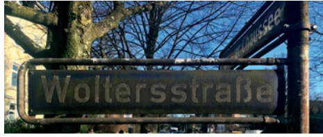
Ihr Strassenschild wartet auf eine pflegende Hand

Es gibt viele Dinge, die Sache des Bezirks oder der Stadt sind: Kaputte Gehwegplatten und