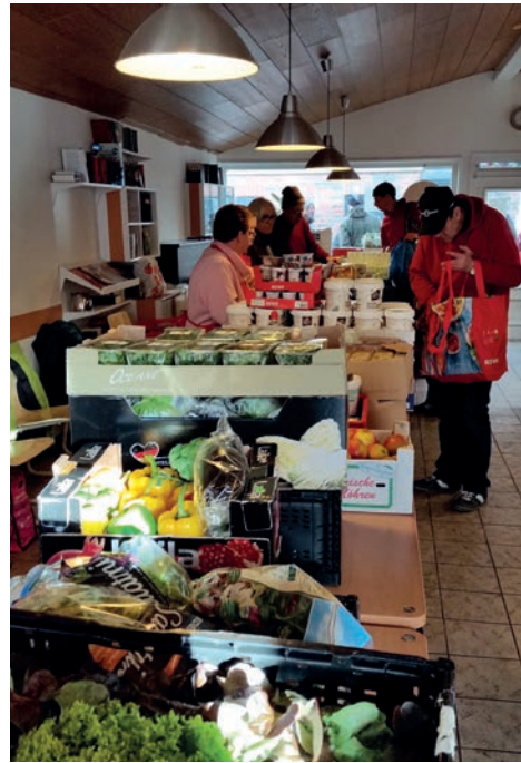
Blick auf das Angebot des Borsteler Tisches

Etwa 30 MitarbeiterInnen sind in den letzten 5 Jahren über 10.000 Stunden lang ehrenamtlich für den Borsteler Tisch tätig gewesen, mit hohem Engagement und Einsatz, mit Spaß und Ernst, immer mit dem Gefühl, eine sinnvolle und wichtige Tätigkeit auszuüben. Klare Regeln und eine ausgefeilte Organisationsstruktur sind Garant für reibungslose Abläufe. Ärgerliche Augenblicke kommen natürlich auch vor, wäre ja