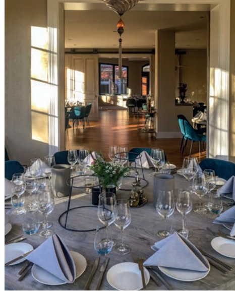
Blick in die Veranstaltungsräume