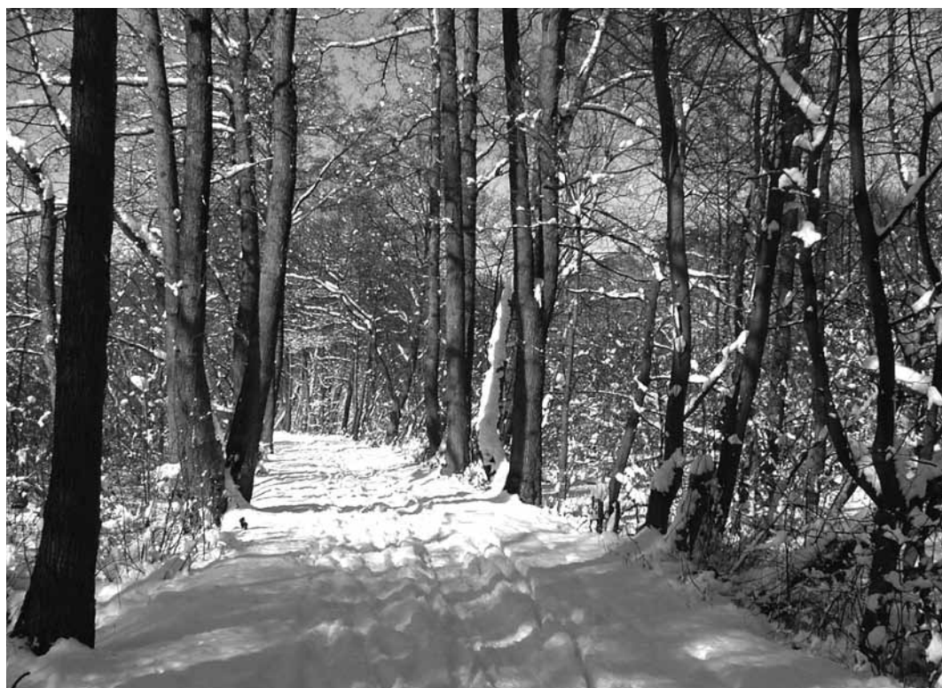
Winterliche Stimmung im Eppendorfer Moor.