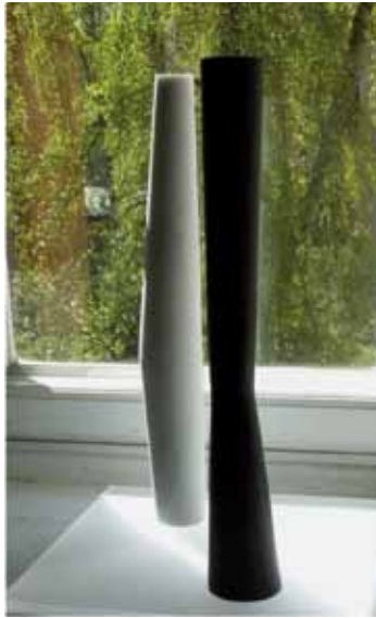
Modelle von Centripetal und Centrifugal (ca. 40 cm Höhe)

Weiteren Künstlerinnen und Künstlern in Groß Borstel, deren Leben und Wirken hier vor Ort bisher viel zu wenig bekannt ist, ein Gesicht zu geben, findet viel Unterstützung. So auch bei den Freunden des