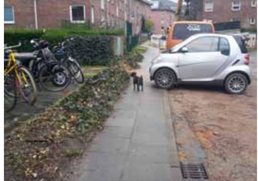
50 cm Durchgangsbreite: zu wenig!

Auch auf dem Fußweg wird gedankenlos bis rücksichtslos geparkt. Haben Sie schon mal versucht, mit Rollstuhl oder Kinderwagen an solchen Hindernissen vorbeizukommen? Lebensgefährlich!