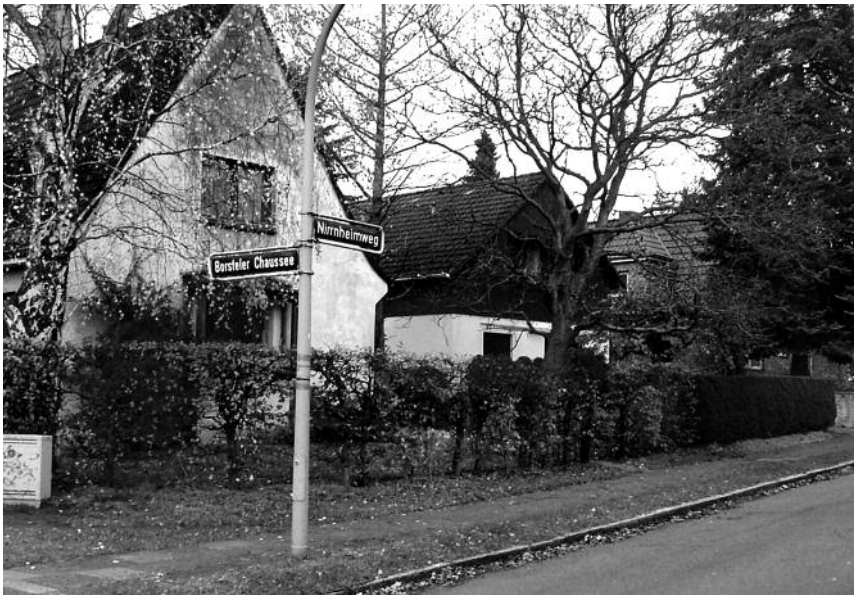
Nirnheimweg 1-5, linke Seite mit Blick in Richtung Dannmeyerstraße. Foto: Archiv KV, 2013