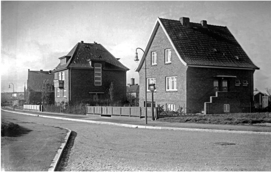
Der noch wenig bebaute Nirrnhemweg mit Wendehammer. Die Dannmeyerstraße wurde erst 1961 angelegt. Rechts im Bild Haus Nr. 31 und 27 mit Blick in Richtung Borsteler Chaussee. Foto: Archiv KV, 1930