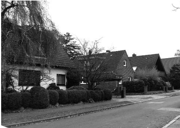
Nirnheimweg 9-11, linke Seite mit Blick in Richtung Dannmeyerstraße. Foto: Archiv KV, 2013