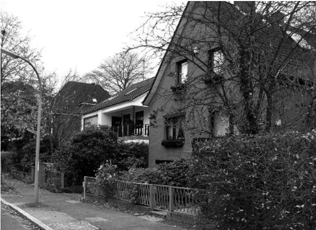
Gleicher Blick wie oben: Nirrnhemweg 31-27