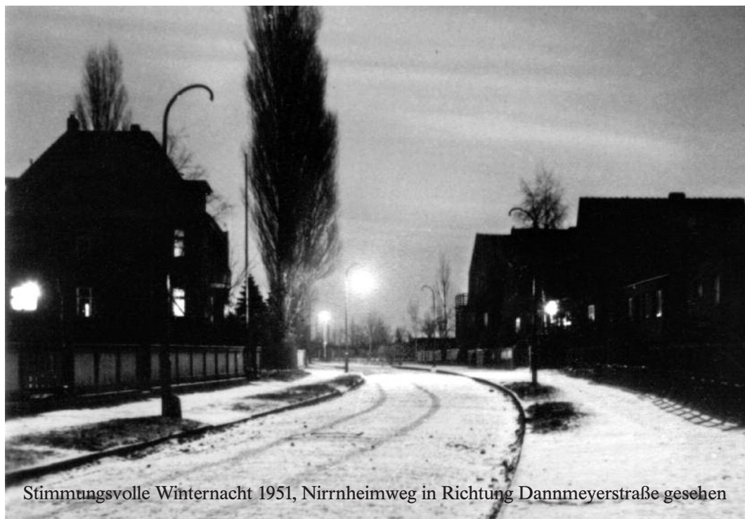
Stimmungsvolle Winternacht 1951, Nirnheimweg in Richtung Dannmeyerstraße gesehen