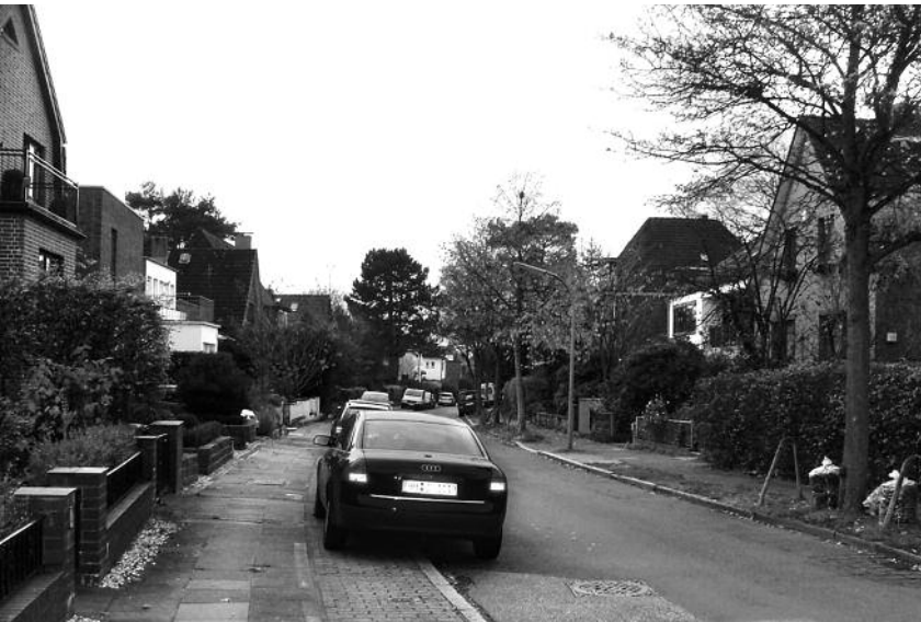
Von der Dannmeyerstraße Richtung Borsteler Chaussee gesehen.