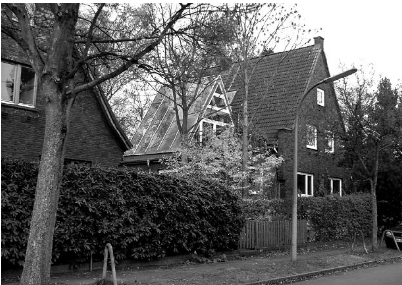
Nirnheimweg 19+21, linke Seite mit Blick in Richtung Dannmeyerstraße. Foto: Archiv KV, 2013