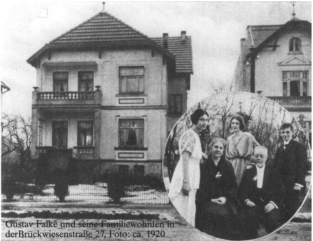
Gustav Falke und seine Familienwohnten in der Brückwiesenstraße 27, Foto: ca. 1920.

Der Dichter Gustav Falke und die Brückwiesenstraße (siehe Artikel auf Seite 19)