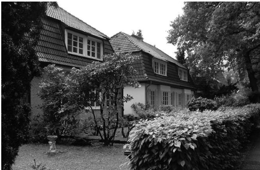
Unten: Brückwiesenstr. Nr. 20 - 14, Blick in Richtung Lokstedter Damm. Foto: Archiv KV, Mai 2011