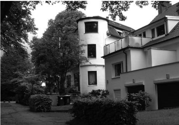
Mitte: Brückwiesenstr. Nr. 30 + 32/ mit Eckhaus am Warnckesweg. Foto: Archiv KV, Mai 2011