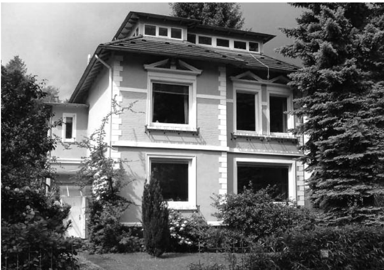
Brückwiesenstr. Nr. 15 Foto: Archiv KV, Mai 2011