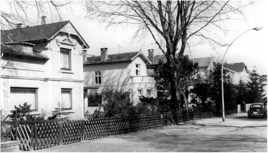
Oben: Brückwiesenstraße von Nr. 7 (links) bis Nr. 17 in Richtung Warnkesweg gesehen. 1985