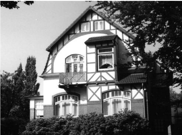
Mitte: Brückwiesenstr. Nr. 3 Foto: Archiv KV, 1989