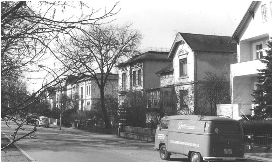
Oben: Brückwiesenstr. von Nr. 27 (rechts) bis Nr. 17 in Richtung Lokstedter Damm gesehen. Foto: Archiv KV, 1972