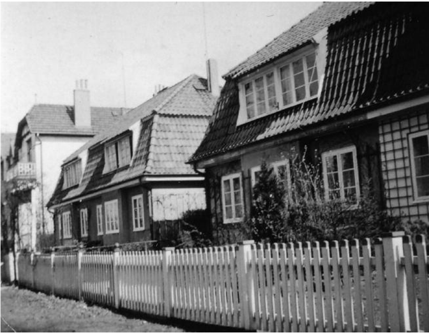
Oben: Brückwiesenstr. Nr. 22 - 28, Blick in Richtung Warnckesweg. ca. 1940