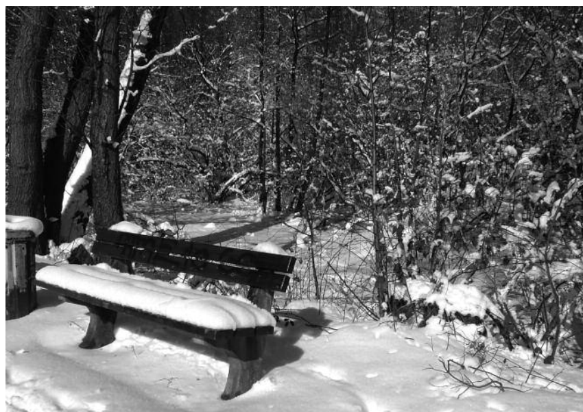
Ein herrliches Plätzchen (vor- zugsweise im Sommer!) mit Blick auf den Teich