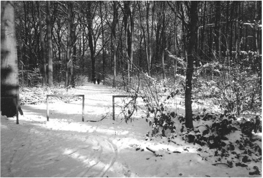
Hauptweg vom großen Teich in Richtung Borsteler Chaussee