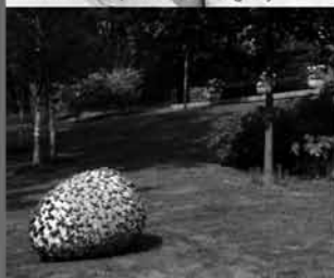
KUNSTWERK STENOVIDO