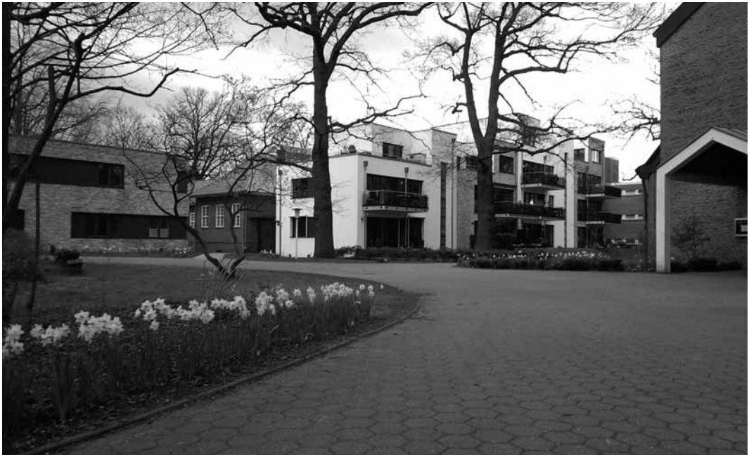
Gemeinde St. Peter - Blick auf die neuen Gebäude - das Gemeindehaus und Wohnungen Foto: D. D., April 2016