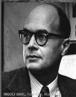
INGOLF DAHL