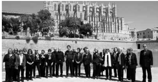
St. Peter. Das Konzert am 27. Mai beginnt um 19 Uhr. Der Eintritt ist frei. Uwe Schröder

Die Kirche St. Peter wird am 27. Mai um 19 Uhr den Auftritt zweier Chöre erleben. Das Repertoire des Dio-Chors aus Krefeld und das von Corvey Cantat aus Groß Borstel/Eppendorf ist ähnlich: Vorgetragen werden Stücke von Bach bis Beatles, von Morten Lauridsen bis zu Abba. Freuen Sie sich auf einen unterhaltsamen Abend mit zwei Chören im Kirchensaal der Gemeinde