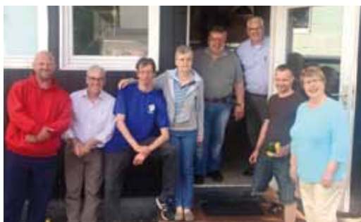
Das Ehrenamtler-Team nach getaner Arbeit: Die Waren sind in Kühltruhen und Kühlschränken verstaut.