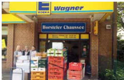
Ein Teil der umfangreichen Spende vom Frische Markt Wagner für den Borsteler Tisch