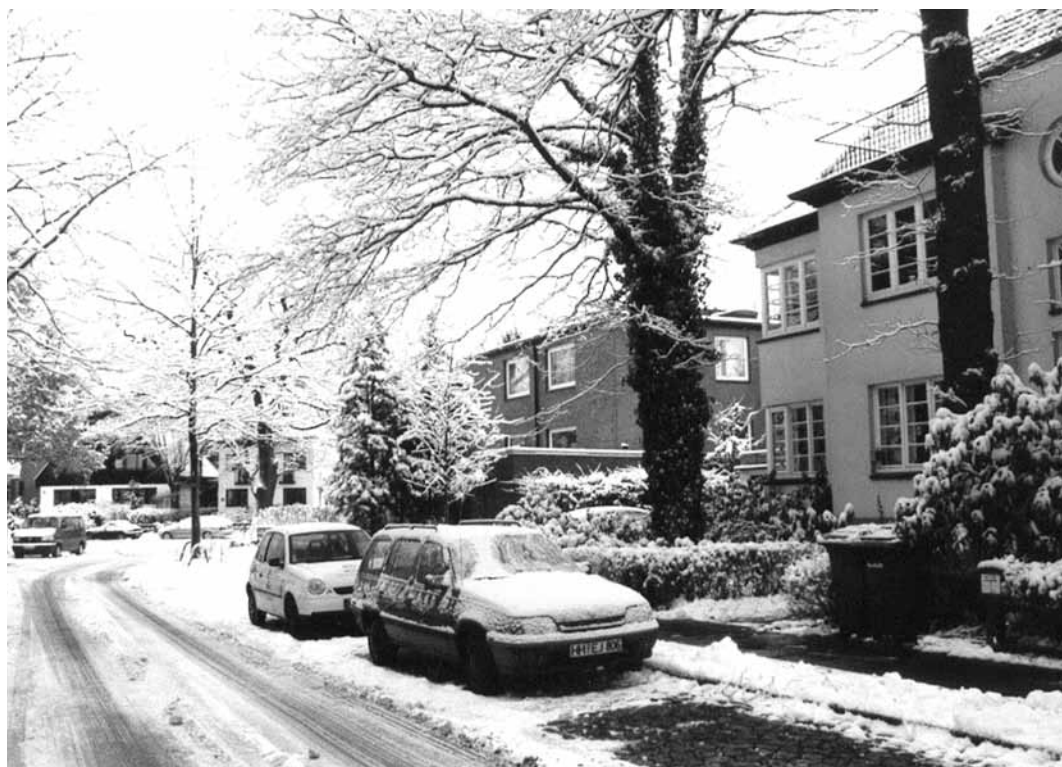
Der verschneite Moorweg mit Blick in Richtung Köppenstraße