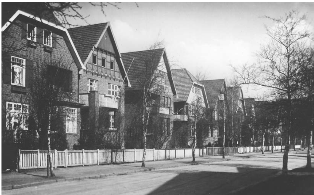
Holunderweg Richtung Schrödersweg gesehen.